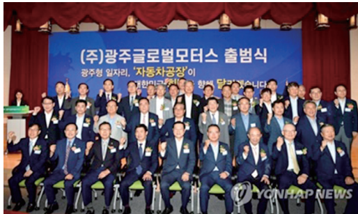
<사회자만 여성인 '광주형일자리' 출범식>