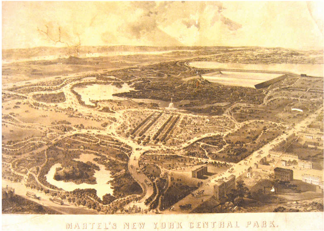
그림 4 뉴욕 센트럴파크 조성 당시