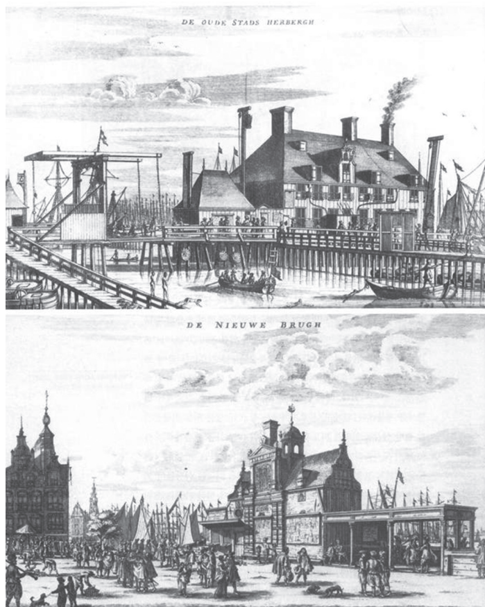
그림 2 암스테르담 시 소유 여인숙과 항구 사무실

예술가와 지식인들의 부상 이탈리아 고전문학과 고전예술의 관심과 회합이 독일, 프랑스, 영국 등으로(ex. 이탈리아 아카데미(1540), 독일 바이마르에(1617), 프랑스 아카데미 프랑세즈(1635), 런던 왕립과학원(1660) 등)