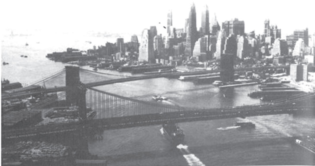
그림 3 뉴욕 브루클린다리와 맨하튼

1880년대 뉴욕 중심부 스카이라인 교회 침탑과 돔 1891년 미 표준어 사전에 Skyscraper라는 단어 등장 1908년 싱어 1911년 올위스 1930년 크라이슬러(77층) 빌딩 1916년 도로 폭의 2배 이상 건축 금지(건축한계선) 셋백(set back)의 경우 0.3m 당 1.2m 가능 개방 공간(공원, 광장)에 면한 경우 고도제한 없어 아파트의 경우는 예외 1930년 그랜드 센트럴 역 주변 개발 맞은 편 63층 산정