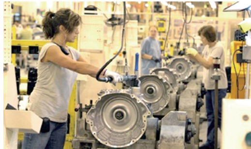
<이탈리아 자동차업체 '피아트' 여성노동자>

2019년 '광주형 일자리' 논의가 한창일 때, 여성제도 논의 테이블에 함께 했지만 광주형 일자리는 결국 형들의 일자리가 되었다. 당시 논의 자리에서 “광주형 일자리는 여성시민을 고려하지 않은 광주남성형 일자리다.”라는 질의에 광주시 담당자는 “여성 배려부문에 대해 광주글로벌모터스 측에 전달하겠다.”라고 답변하였다. 여성시민의 일자리는 배려의 대상이 아닌, 당연히 고려해야 하는 것임에도 말이다.